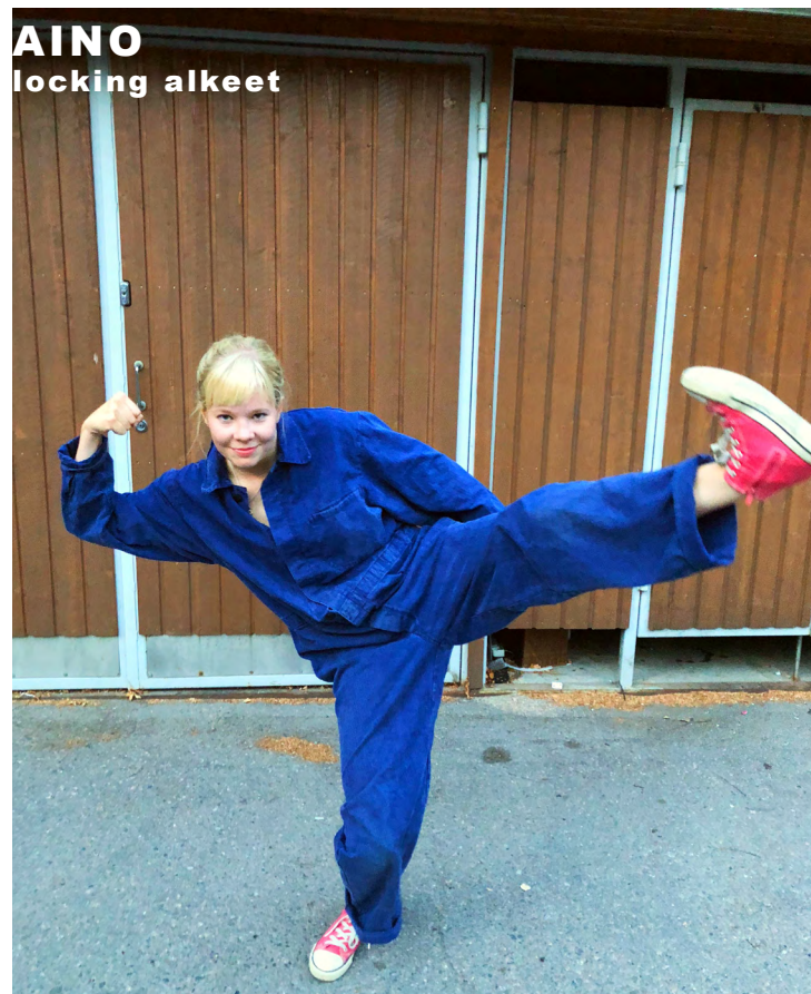
AINO locking alkeet

Kysy kurssista: ainotuuli.vaittinen@gmail.com TG: @ihqaino